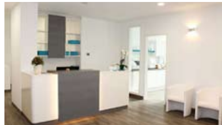
Modernes Ambiente im Anmelde- und Wartebereich sowie in den Behandlungsräumen

logie, Heimtiermedizin, Verhaltensmedizin), die fachübergreifend zusammenarbeiten, um diagnostische Untersuchungen und daraus resultierende Therapien möglichst schnell durchführen zu können. Dabei legen wir großen Wert darauf, dass Ihnen immer ausschließlich ein Spezialist als direkter Ansprechpartner zur Verfügung steht.